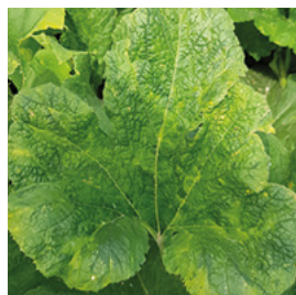
Abb. 2 Virusbefall an Cucurbita pepo

Die Blattläuse schwächen die Pflanzen, indem sie Assimilate aussaugen. Dies ist jedoch meist von geringerer Bedeutung, da die Kürbisse dies in den meisten Fällen durch starkes Wachstum kompensieren können. Viel Stärker ist der Schaden durch Virusinfektionen, welche die Blattläuse beim Saugen übertragen. Besonders anfällig sind kleine Pecosorten wie Orangita, Jack be little, und Hokkaidosorten.