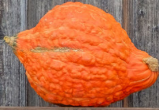
Golden Hubbard gewarzt