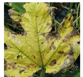
Abb. 6 Didymella an Blatt