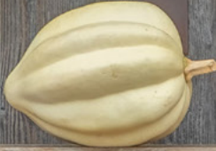
Cream of the Crop