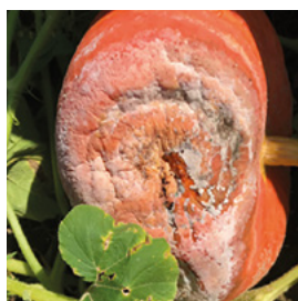
Abb. 10 Phytophthora an Cucurbita maxima Sorte Etampes

Vorbeugung: Vermeiden von Überkopfbewässerung, Anbaupause von 3 Jahren, Ernte der reifen Früchte bei drohender Schlechtwetterperiode, Vermeiden von feuchten Standorten, Vermeiden von Staunässe.