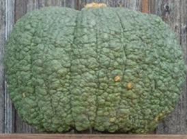
Buen Gusto de Horno