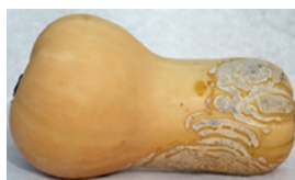
Abb. 7 Didymella an Cucurbita moschata Sorte Butterscotch

Direkte Bekämpfung: Pflanzenschutzbehandlung in Abständen von 7-14 Tagen mit vorbeugenden Mitteln.