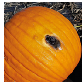
Abb. 12 Schwarzfäule an Cucurbita pepo Sorte Boomer

Der Pilz benötigt für die Keimung hohe Temperaturen und viel Feuchtigkeit. Oftmals sind dafür schlechte Lagerbedingungen oder Feuchtwarme Witterung verantwortlich.