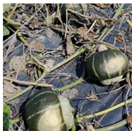
Abb. 8 Sonnenbrand an Cucurbita maxima Sorte Bon

Fallen die Blätter früh zusammen und steht die Sonne brennend am Himmel, kann dies bei hohen Temperaturen zu Sonnenbrand an den Früchten führen. Besonders dunkelgrüne und dunkelrote Sorten sind davon betroffen.