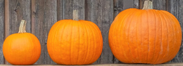
KCB Halloween Mischung