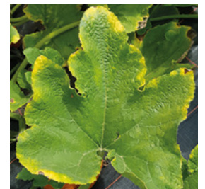
Abb. 5 Didymella an Blatt

Schadbild: Didymella Bryoniae befallt zuerst das Blatt, welches von aussen her gelb aufhellt. Im weiteren Krankheitsverlauf verfärben sich die aufgehellten gelben Partien rotbraun und sterben ab. Oft sieht man auch Flecken welche absterben und später wie Einschusslöcher ausschauen. Danach welken ganze Stängel, welche braun werden, sich gummiartig zusammenziehen und absterben. Bei vielen Moschussorten befallt Didymella später auch die Frucht, welche ringförmige helle trockene Flecken aufweisen, die die Früchte unverkäuflich machen.