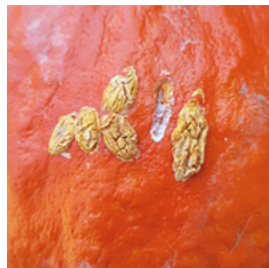
Abb. 1 Mäuseverbiss an Cucurbita maxima Sorte Fictor

Die Schäden an Pflanzen durch Mäuse sind oft vernachlässigbar. Jedoch werden die Schäden an den Früchten nicht selten zum Problem. Besonders im Herbst nagen Mäuse an den Früchten und verursachen Frassspuren. Die Früchte faulen meist nicht, sehen jedoch oft unverkäuflich aus. Mäuse verursachen bei Hokkaidotypen oft grosse Schäden.