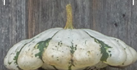
blanc panache vert