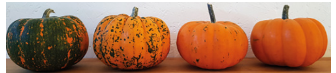
Abb. 3 Viruserkrankung an Cucurbita pepo Sorte Orangita, links starker Befall, rechts kein Befall.

Direkte Massnahmen: Bestand besonders im Jugendstadium frei halten von Blattläusen. Meist genügt eine Spritzung im 4-6 Blattstadium. Der Virus kann in der Pflanze ausschliesslich nach Aussen wandern. Alle innenliegenden Früchte werden bei einer späten Infektion nicht befallen. Deshalb ist eine späte Infektion nicht dramatisch.