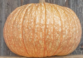
One too Many