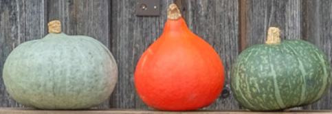
KCB Maxima Mischung