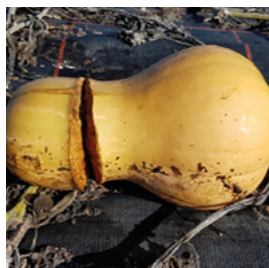
Abb. 9 Virusbefall an Cucurbita pepo

Schadbild: Die Früchte weisen gegen die Abreife einen Riss oder Spalt auf, wo sie deutlich geplatzt sind. Dies kommt hauptsächlich bei Butternut-sorten vor.